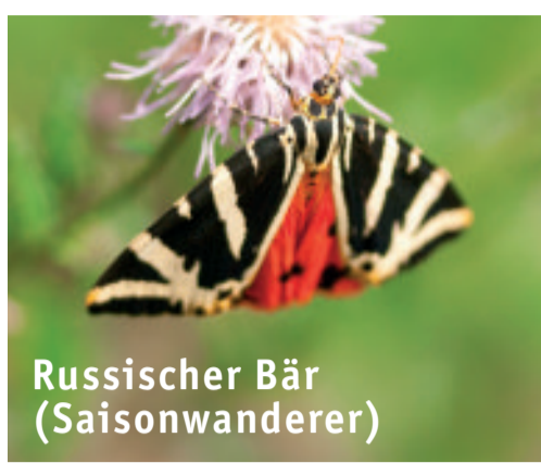
Russischer Bär (Saisonwanderer)

Während Schmetterlinge eher tänzelnd nach Nahrung, Paarungspartner oder Eiablageplatz suchen, zeigen wandernde Falter ein völlig anderes Flugverhalten. Sie fliegen einzeln oder in